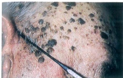
โรคผิวหนังใน

ด้วยสาเหตุดังกล่าวข้างต้น การป้องกันดูแลผิวหนังจึงจำเป็น และควรปฏิบัติตั้งแต่เนิ่น ๆ เช่น เวลาอาบน้ำไม่ควรอาบน้ำร้อน หรือถ้าจำเป็นก็ควรใช้ครีมทาผิวที่เหมาะสมกับสภาพผิว โดยทาหลังอาบน้ำ ไม่ควรใช้ผงซักฟอกแรงเกินไป รู้จักแต่งตัวโดยใช้เสื้อผ้าที่เหมาะสม เครื่องสำอางควรใช้เท่าที่จำเป็นและปลอดภัย ควรใช้ครีมกันแดดเพื่อป้องกันไม่ให้ผิวถูกแสงแดดมากเกินไป เพราะนั่นอาจเป็นสาเหตุของผิวแก่ก่อนวัยและมะเร็งผิวหนังได้