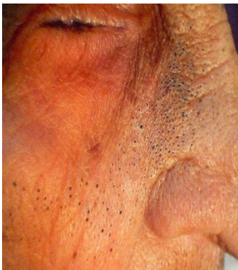
ภาพ senile comedone

ผิวหนังผู้สูงอายุ มักพบในคนสูงอายุ ที่โดนแสงแดดมาก และ นานๆ เช่น ชาวนา ชาวสวน มักพบเป็นสิ่วจุดตันหัวปิด บริเวณรอบๆ ตาและโหนกแก้ม และ อาจจะขยาย เป็นสิ่วหัวเปิด ไม่มีลักษณะเป็นสิ่วอักเสบ บวมแดง