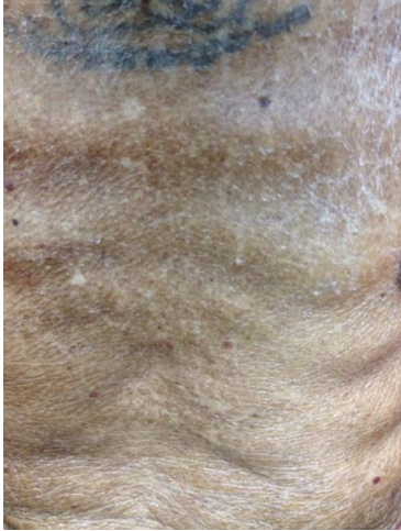
ภาพแสดงผิวหนังแห้งอักเสบอย่างรุนแรง

รอยเหี่ยวย่นในผู้สูงอายุ (แอกตินิค อีลาสโตสิส) เป็นการแก่ตัวของผิวหนังที่เกิดขึ้นก่อนวัย เกิดจากการเสื่อมสภาพของเนื้อเยื่อที่ยืดหยุ่นในชั้นผิวหนังแท้เนื่องจากการสัมผัสแสงอาทิตย์เป็นระยะเวลานาน