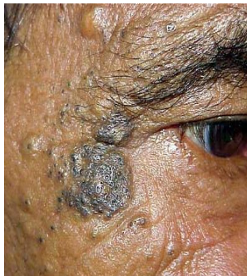
ภาพ favre racouchot

จุดด่างดำในผู้สูงอายุ (ซีไนล์ เลนติโก) เป็นผื่นราบสีน้ำตาลขนาดเล็กขอบเรียบรูปร่างกลมซึ่งปรากฏที่หน้า คอ หรือ หลังมือในคนแก่จำนวนมาก สาเหตุเกิดจากมีเม็ดสีในผิวหนังมากขึ้นที่ผิวหนังบริเวณนั้น ผื่นเหล่านี้ไม่มีอันตรายแต่อย่างใด แม้ว่าผื่นเหล่านี้จะเกี่ยวข้องกับการมีอายุมากขึ้น แต่สาเหตุหลักของผื่นชนิดนี้ไม่ใช่อายุแต่เป็นการสัมผัสแสงแดดและลมมาเป็นเวลาหลายปี