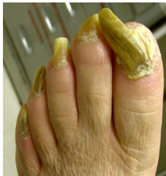
ภาพเล็บงุ้ม ( onychogryposis)

บริเวณเล็บจะเริ่มเปลี่ยนแปลงคือ มีสีขุ่น เหลือง เล็บเริ่มผุ เปราะ หักง่าย ปลายเล็บอาจแยกเป็นชั้น ๆ บางเล็บอาจยาวโค้ง และงุ้มคล้ายเล็บนก(Onychogryposis) บางรายมีอาการอักเสบบวมแดงจากการติดเชื้อราหรือแบคทีเรียร่วมด้วย เป็นต้น