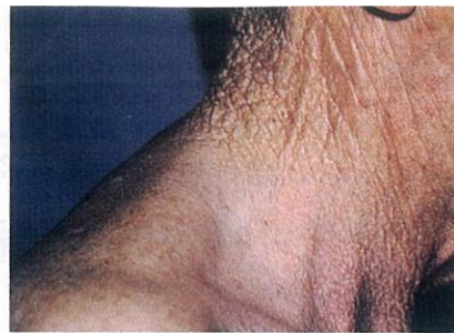
แสดงผิวหนังที่เยียนเนื่องจากแสงแดด