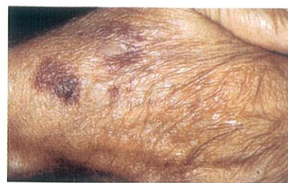
แสดงผิวหนังเสื่อมสภาพจากแสงแดดในผู้สูงอายุ

ลักษณะเป็นรอยนูนคล้ายขนาดเล็ก ลักษณะเป็นนูนออกซึ่งมักเกิดขึ้นบริเวณใบหน้า คอ และลำตัว มีชื่อภาษาอังกฤษว่า “เซบอร์เรอิก เคอราโตซิส” หรือกระเนื้อ พวกนี้ไม่มีอันตรายนอกจากไม่สวย ถ้ารู้สึกว่ารำคาญลูกนี้หน้าตา ก็ควรจะไปปรึกษาแพทย์เพื่อเอาออก